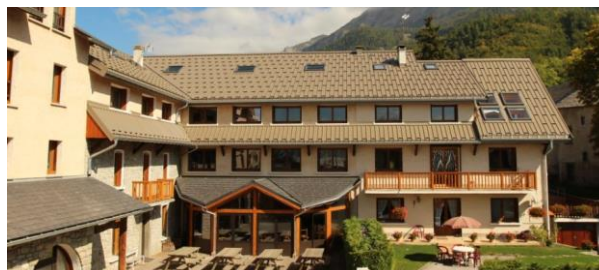
Chalet les Prés Jaunes

Vous serez reçu dans un bâtiment de type hôtelier avec un point phone et le WIFI.