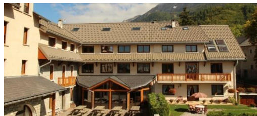
Chalet les Prés Jaunes

Vous serez reçu dans un bâtiment de type hôtelier avec un point phone et le WIFI.