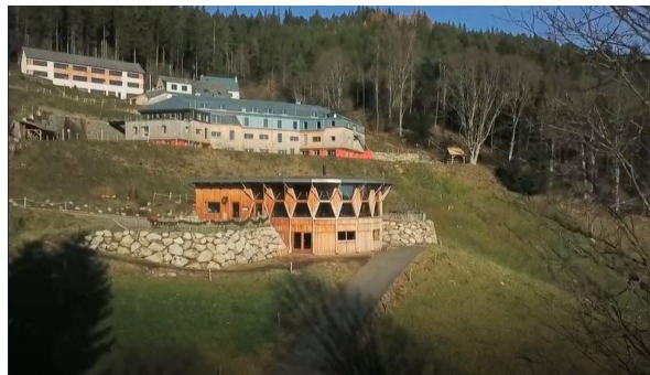
Le domaine du Beubois

Un formateur pourra venir vous chercher à l'arrêt du car "Bethléem", le samedi soir si vous prévenez le secrétariat au moins huit jours avant la date du stage.