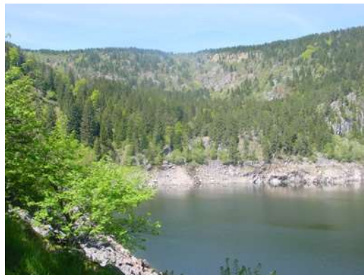
Le Lac Noir

Un formateur pourra venir vous chercher à l'arrêt du car "Bethléem", le samedi soir si vous prévenez le secrétariat au moins huit jours avant la date du stage.