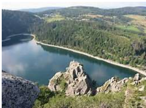
Le lac blanc