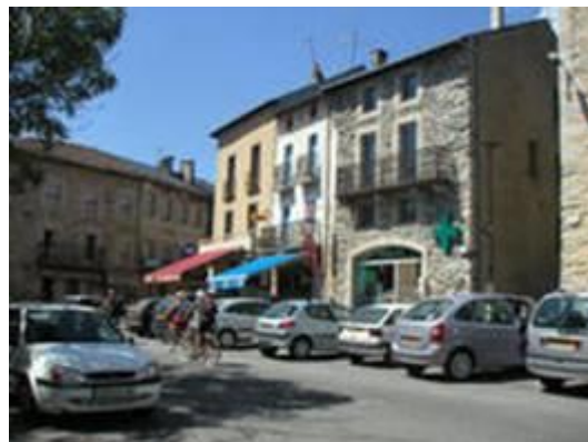
Le centre du village

Situé à 1500 m d'altitude dans les Pyrénées-Orientales, sur le plateau du Capcir, FORMIGUÈRES, c'est la nature et un patrimoine préservé au cœur du Parc Naturel Régional des Pyrénées.