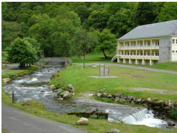
Chalets Saint Nérée