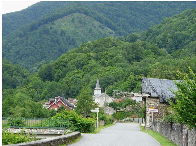
Entrée du village de Ferrère

La commune est desservie par la route départementale 925, dont elle représente le terminus au lieu-dit Granges de Crouhens. Une route vicinale continue jusqu'au port de Balès à 1755 mètres d'altitude, permettant l'accès à la vallée d'Oueil.