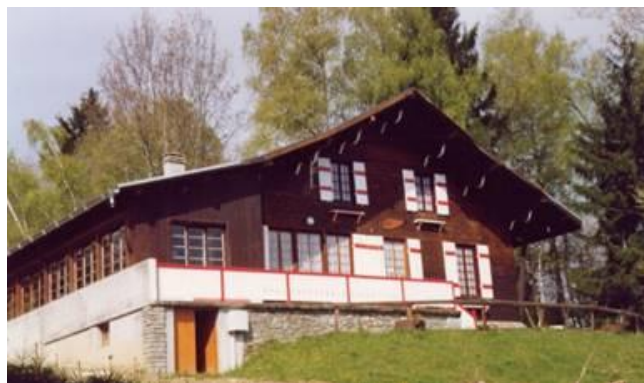
Chalet du haut (Noces d'Or)