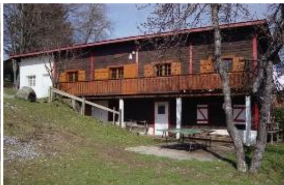
Chalet du bas