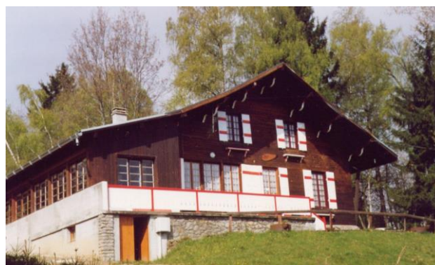
Chalet Noces d'Or

L'ascenseur est réservé aux personnes à mobilité réduite