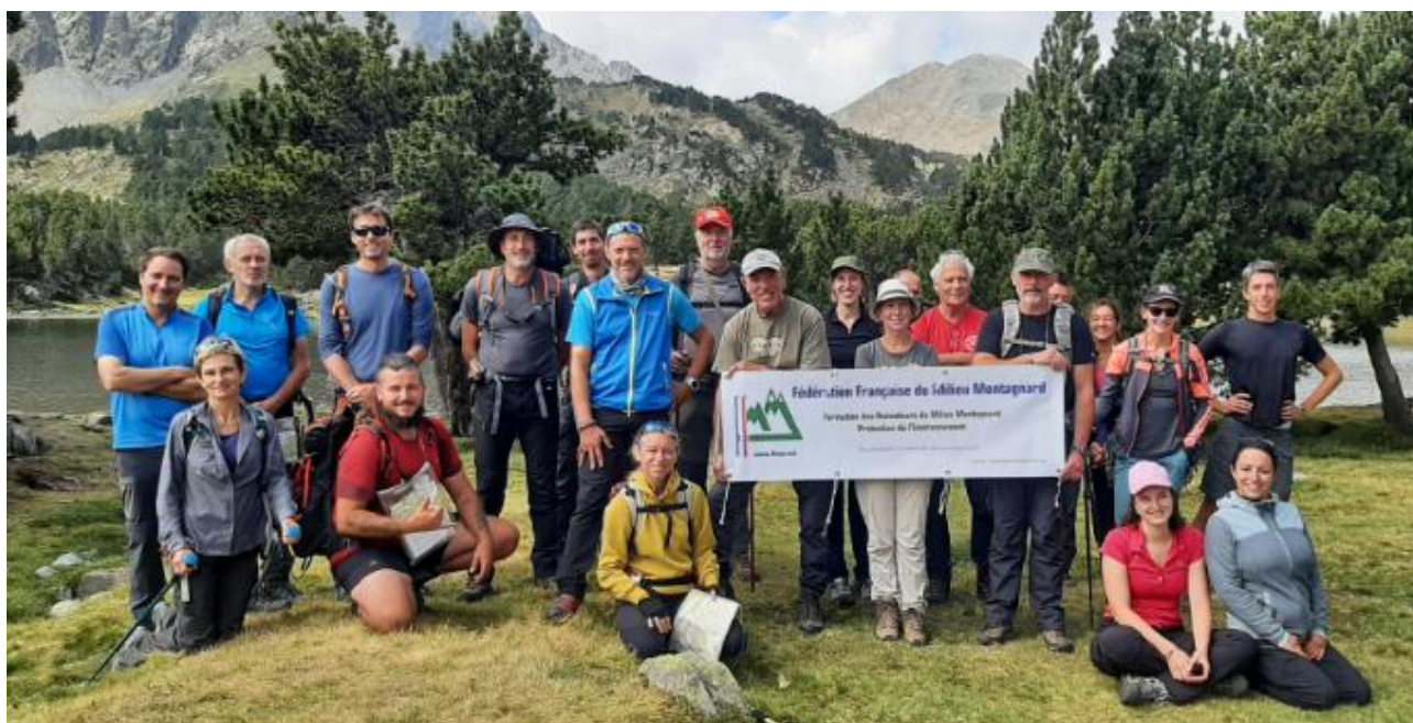
Module 2 - 2021 - Formiguères (Pyrénées-Orientales).

Après avoir obtenu le brevet fédéral d'accompagnateur de randonnées pédestres vous pouvez constituer un dossier pour le certificat de compétences d'accompagnateur/accompagnatrice en milieu montagnard et rural.